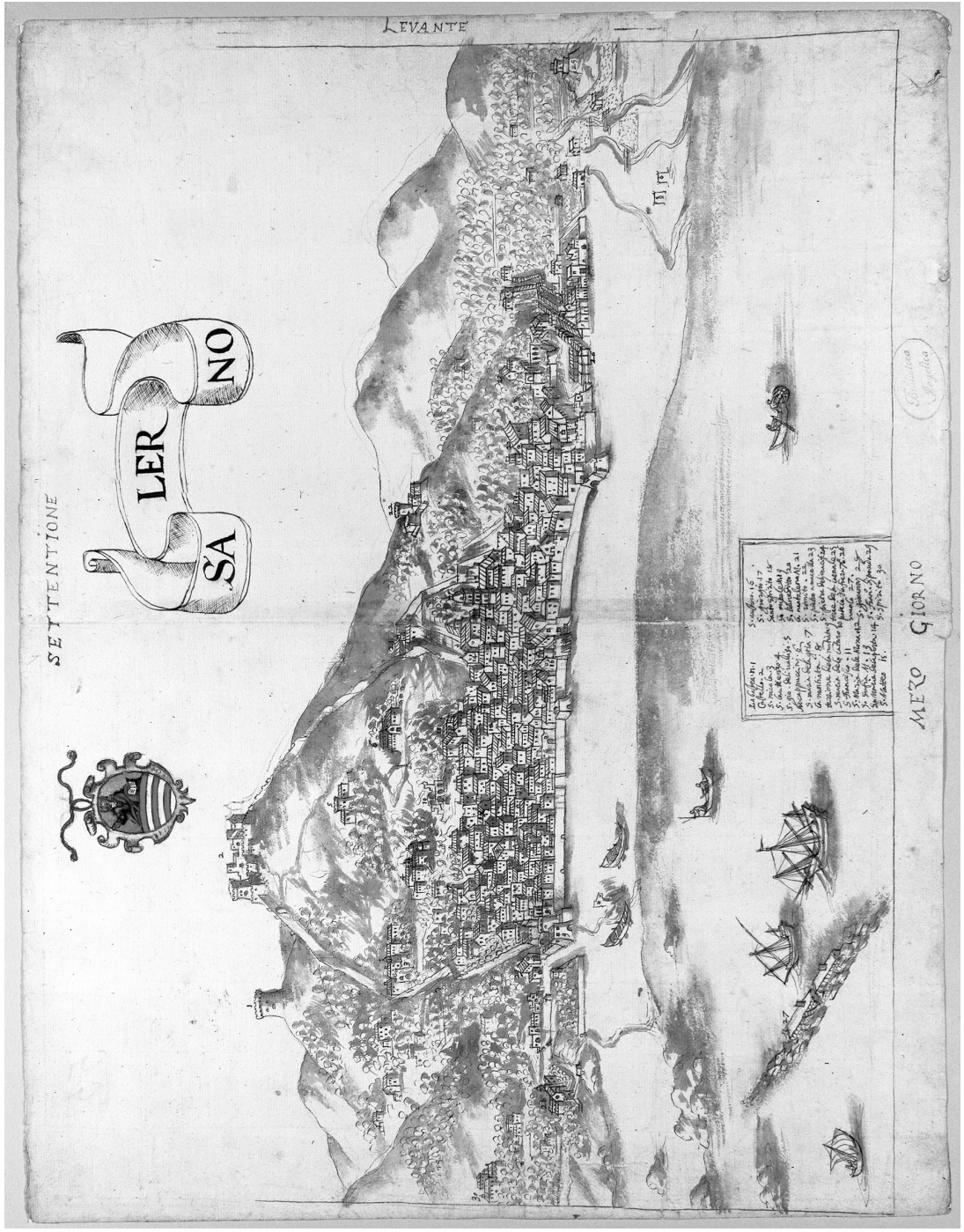
Veduta di Salerno (disegno a penna degli anni Ottanta del XVI secolo) – Roma, Biblioteca Angelica, BSNS 56/55.