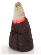
Ilustrace depropiálního úzu hořící františek (tj. kadidlo ze dřeva, páleného v kostele) (Wikipedia)