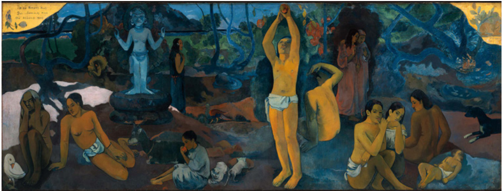
Figura 1. Paul Gauguin, Da dove veniamo? Chi siamo? Dove andiamo? (1897), Museum of Fine Arts, Boston, Stati Uniti.

La storia dei popoli, che hanno una storia, è, si dice, la storia della lotta delle classi. La storia dei popoli senza storia è, si dirà con almeno altrettanta verità, la storia della loro lotta contro lo Stato. P. Clastres, La società contro lo Stato 1