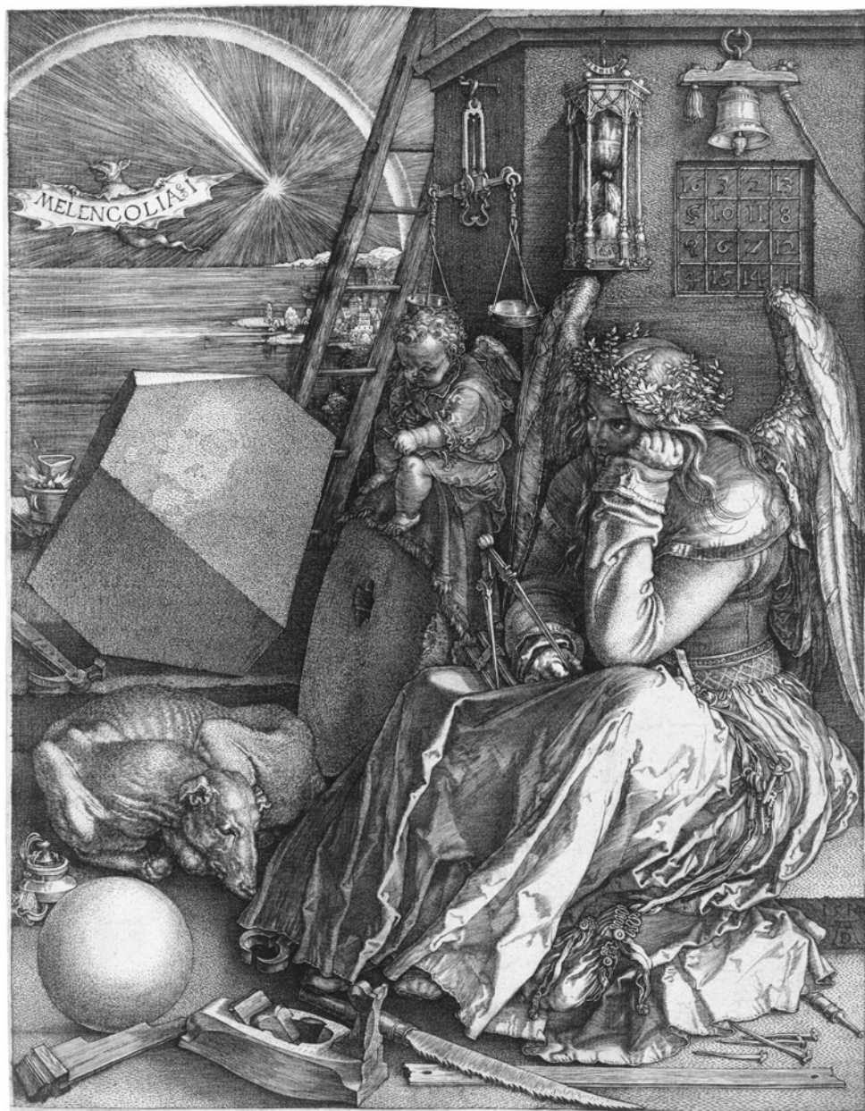
Figura 1. Albrecht Dürer, Melencolia I , 1514. Incisione a bulino, 24 × 18,8 cm, Staatliche Kunsthalle, Karlsruhe.