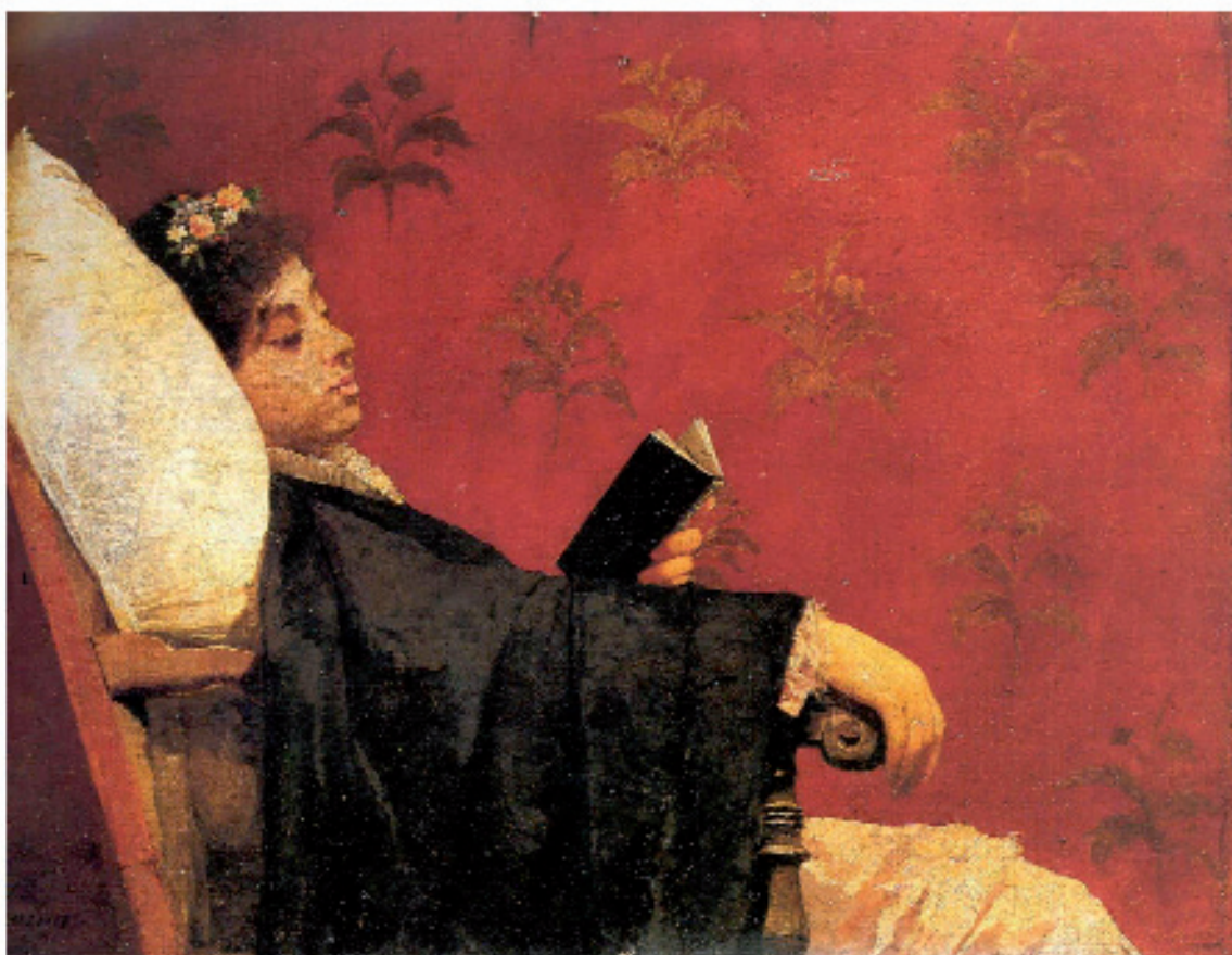
Gioacchino Toma, Donna che legge sdraiata olio su tela, datazione incerta Collezione privata