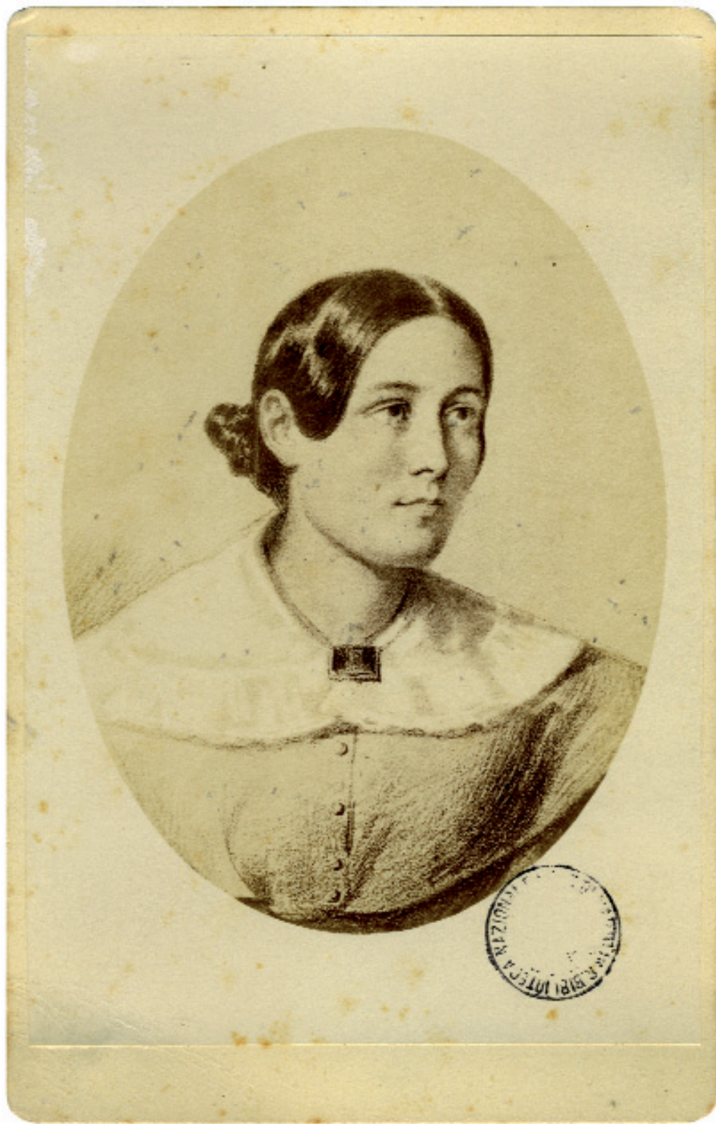
Paolina Ranieri Biblioteca Nazionale di Napoli, Carte Ranieri B 59/145 (8)