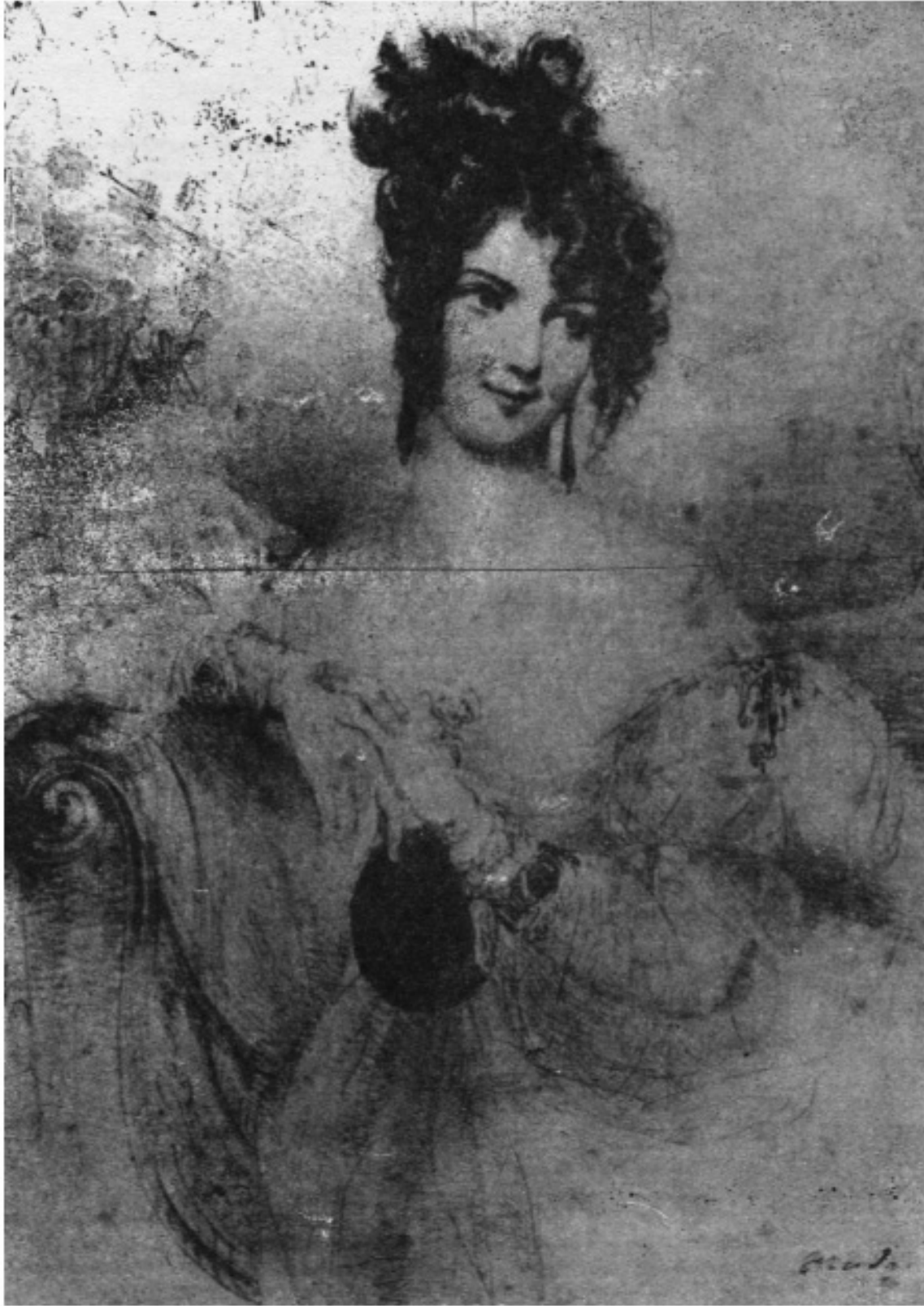
Louise Colet , in A. Aruta Stampacchia Louise Colet e l'Italia , Geneve, Ed. Slatkine, 1990 Biblioteca Nazionale di Napoli, 1995 B 0852 (p. 64)