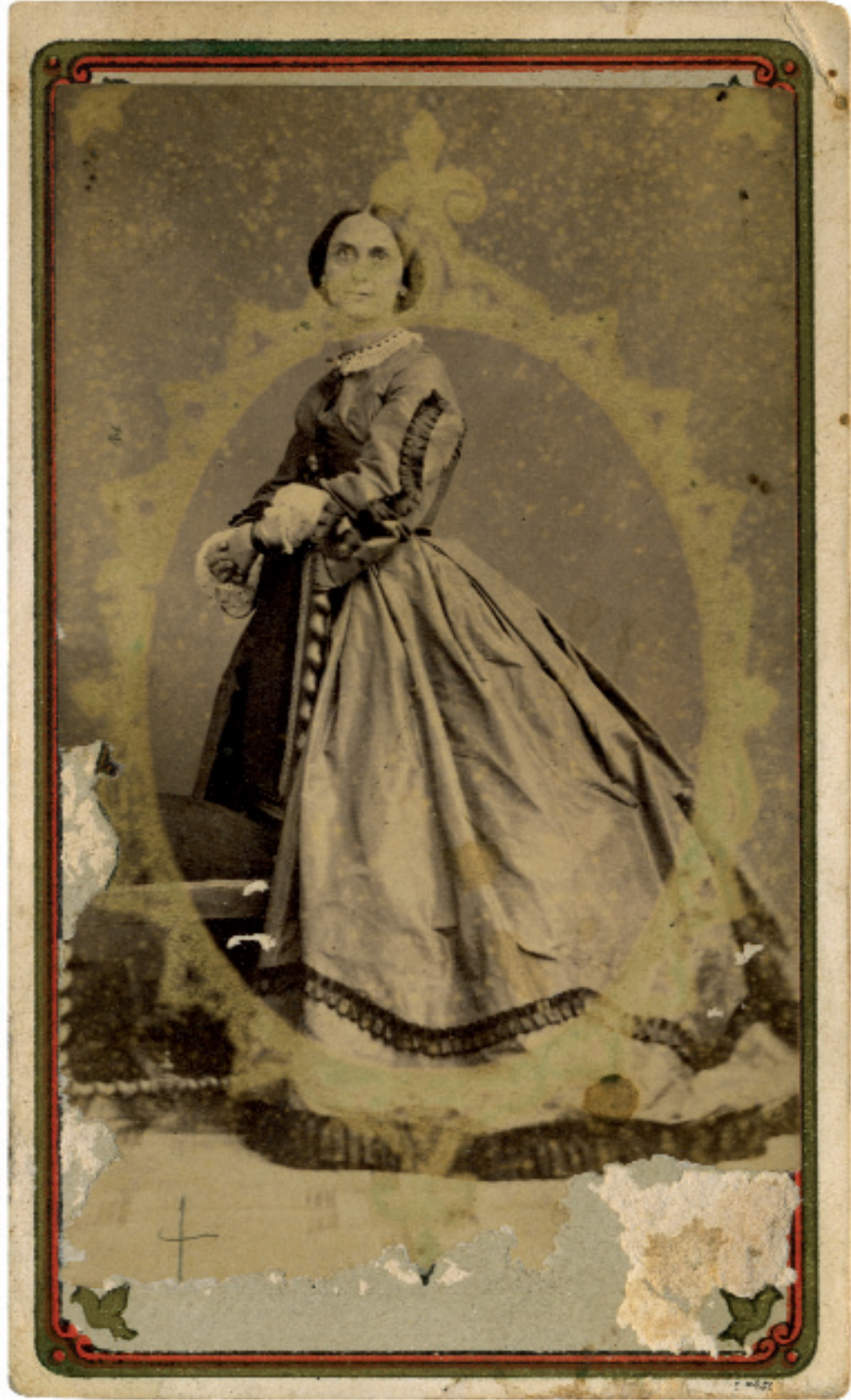
Giannina Milli Biblioteca Nazionale di Napoli L. P. Fot. 1301